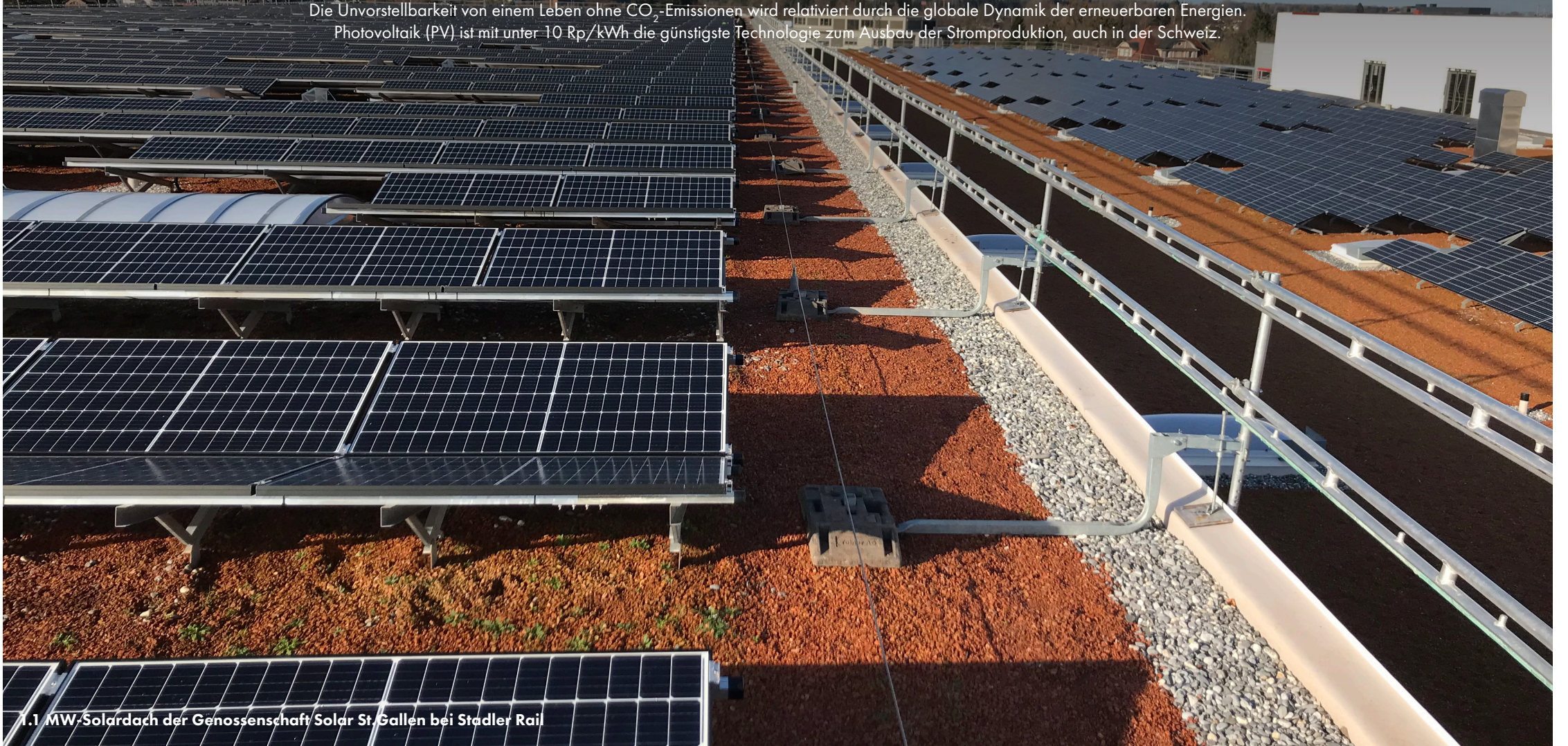
1.1 MW-Soldach der Genossenschaft Solar St. Gallen bei Stadler Rail

Basierend auf fossilen Brennstoffen können Asien und Afrika niemals mobil und wohlhabend werden – deshalb setzt China auf erneuerbare Energien und Elektromobilität. Die Unvorstellbarkeit von einem Leben ohne CO 2 -Emissionen wird relativiert durch die globale Dynamik der erneuerbaren Energien. Photovoltaik (PV) ist mit unter 10 Rp/kWh die günstigste Technologie zum Ausbau der Stromproduktion, auch in der Schweiz.